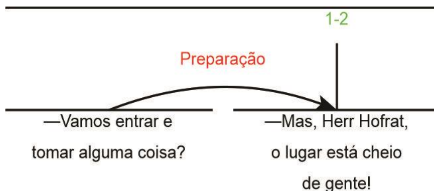
Diagrama 1: Estrutura Retórica do Par dialógico ( P-R) da piada 1.

Em relação à RST, entre (1) e (2) tem-se uma relação do tipo núcleo- satélite , em que (1) constitui uma pergunta – P e representa o satélite , e (2) que corresponde à resposta - R e se configura como núcleo . Entre elas é plausível argumentar que emerge a relação de preparação , pois o leitor se sente interessado a ler o núcleo, ou seja, a resposta. Vê-se que a resposta se inicia com o marcador discursivo mas , que tem a função de organizador textual. Segundo Taboada (2006, p. 6), a definição das relações se baseia em critérios funcionais e semânticos, não em sinais morfológicos ou sintáticos, porque nenhum sinal é totalmente confiável ou inequívoco para a identificação de nenhuma das relações retóricas, pois a utilização de um sinal nem sempre traz a noção perpetuada pelo conceito de uso tradicional, ou seja, ele pode adquirir funções de acordo com a situação discursiva construída em adequação ao gênero proposto.