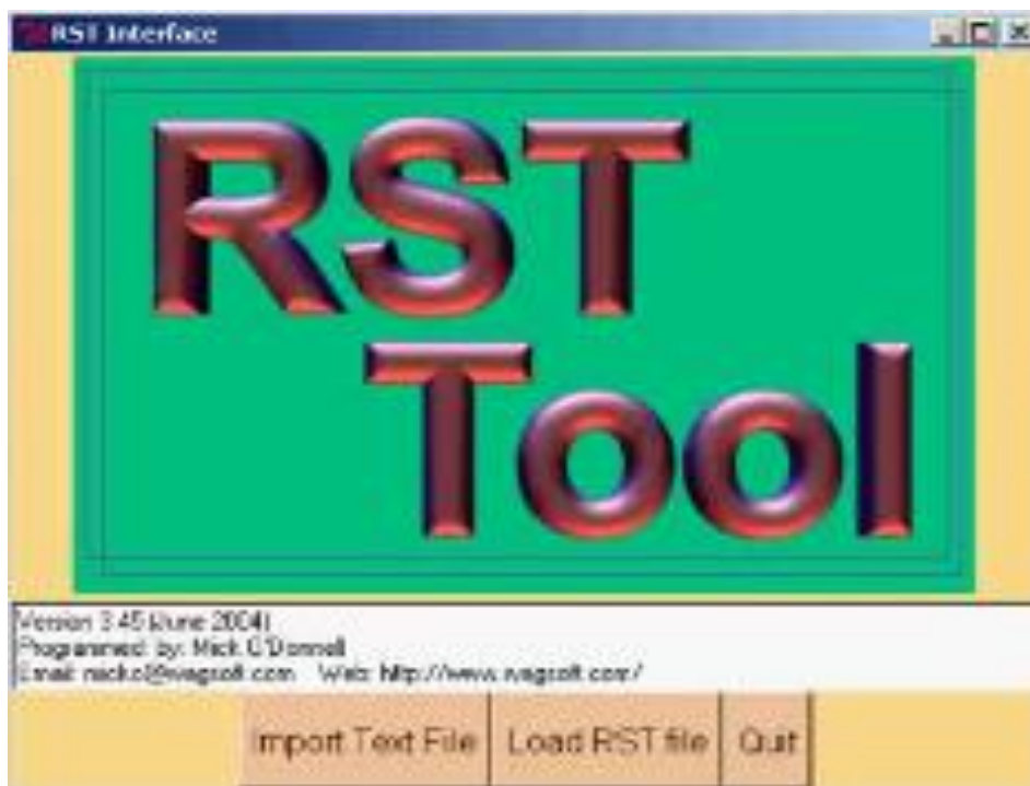
Figura 1: Programa RSTTool , versão 3.45, de Mick O'Donnell. Disponível: www.wagsoft.com . Acesso em: 12 mar. 2024.

Na constituição do par pergunta- resposta , considera-se a unidade de análise semelhante à unidade informacional de Chafe (1982), e ainda se concebe como limites de cada unidade do par dialógico, quando a resposta à pergunta vem antecedida dos verbos de elocução como responder , ou de segmento inicial ao par. Além disso, entende-se que o par dialógico nem sempre é constituído, nas piadas, com relação à pergunta de uma interrogativa direta e indireta demarcados pelos pontos de interrogação e final.